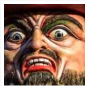
Reuzen nemen Maastricht in