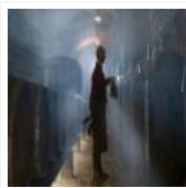
Aan tafel in Maastricht