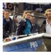
Flikkendag Maastricht 2014